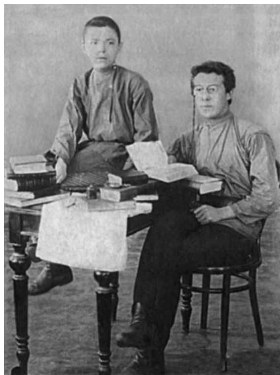
Питирим Сорокин с Николаем Кондратьевым. Начало XX в.

но выбора своей будущей специальности: химия или социология? И относительно учебного заведения: Университет или Психоневрологический институт? Решение первой дилеммы в пользу социологии автоматически решило и вторую в пользу Психоневрологического института. Обстоятельства, однако, сложились так, что здесь Сорокин проучился лишь год, после чего перевёлся на юридический факультет Петербургского университета и очень быстро выдвинулся в число лучших студентов. С 1910 г. регулярно появляются его научные публикации. Круг научных контактов юноши необычайно широк и включает таких светил мировой науки, как И.П. Павлов и В.М. Бехтерев. Ещё студентом университета он с благословения своих учителей начинает читать студентам младших курсов собственные лекции по социологии, одновременно работая секретарём у М.М. Ковалевского. Последний почти сразу заметил необычайное научное дарование Сорокина и сыграл по отношению к нему ту же роль, что “старик Державин” по отношению к Александру Пушкину.