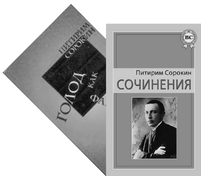
Обложки книг П.А. Сорокина

чатление, что Ильич имеет в виду какую-нибудь незначительную кучку “белогвардейцев”, насчитывающую пять-шесть человек. Но нет, в списке лиц, привлечённых к участию в “Экономисте”, 53 человека.